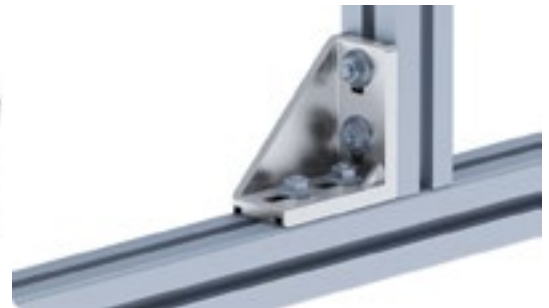
Aluwinkel 40/80 Alu Connection Angle 40/80